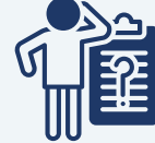
Pwoblèm medikal konplike