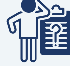
مشاكل طبية معقدة